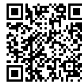
Tutoriel (papier pour impression)